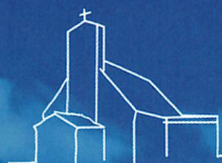
St. Matthäus Stellenfelde