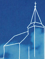
St. Matthäus Brunsbrock